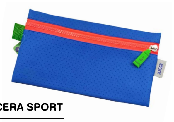
LAPICERA SPORT LTS