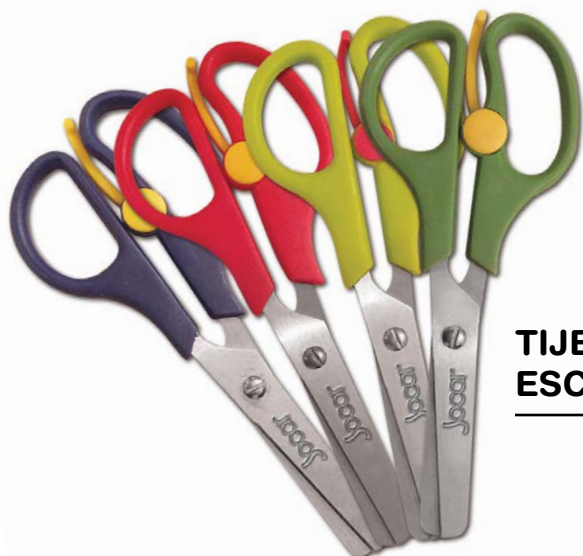
TIJERA ESCOLAR 5"