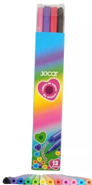
COLORES FORMA DE CORAZON C/12