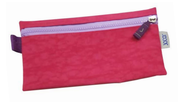
LAPICERA TEXTIL RUGOSA LTR