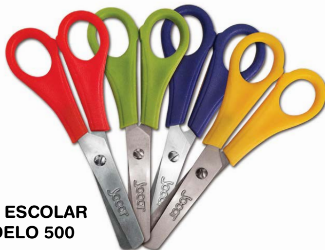
TIJERA ESCOLAR 5" MODELO 500