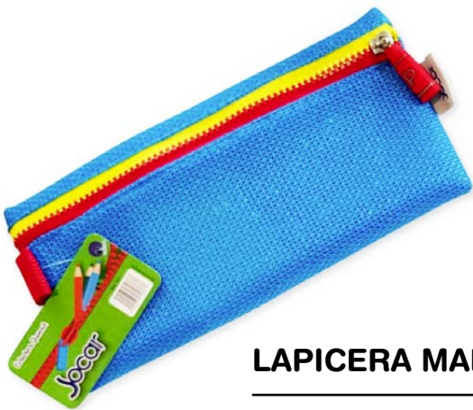
LAPICERA MALLA LTML