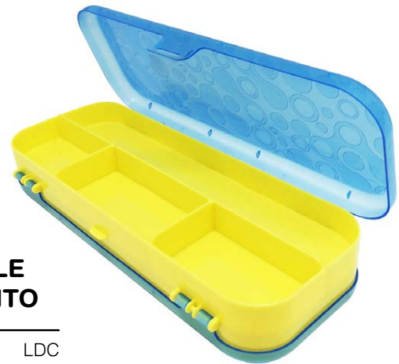
LAPICERA DOBLE COMPARTIMIENTO