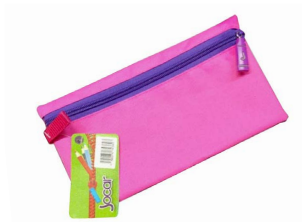
LAPICERA TEXTIL LISA CON AROMA LTLA