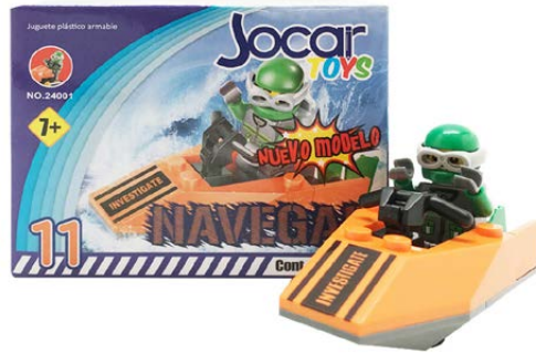
JUGUETE ARMABLE JA8 # 11