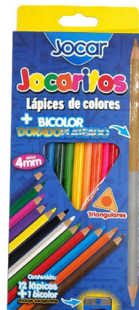
COLORES JOCARITOS DOBLES C/12 4MM