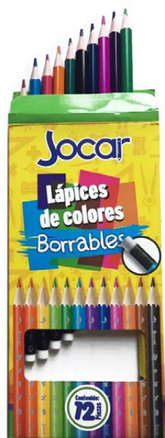
COLORES BORRABLES TRIANGULAR C/12 LARGOS