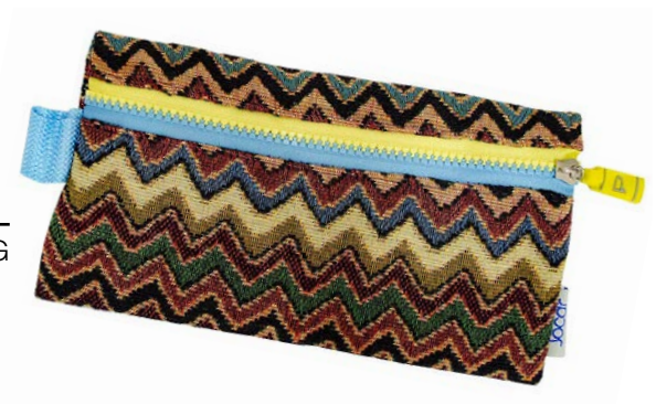
LAPICERA ZIG ZAG LETZG