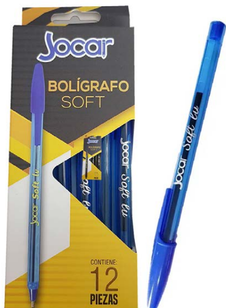
BOLIGRAFO LISO AHUMADO AZUL