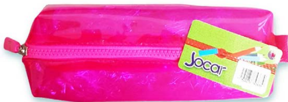
LAPICERA CUBO DIAMANTADO