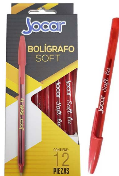
BOLIGRAFO LISO AHUMADO ROJO