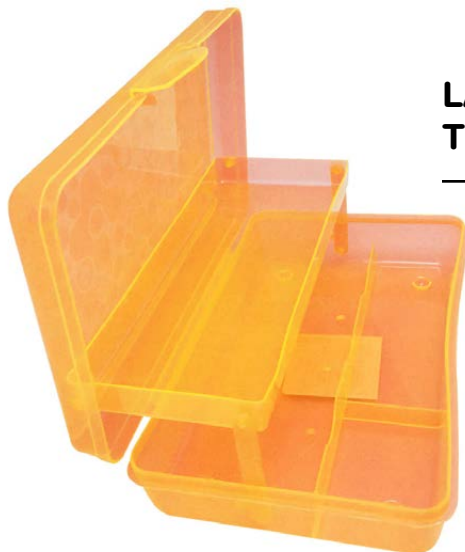
LAPICERA ESCALERA TRANSLUCIDA