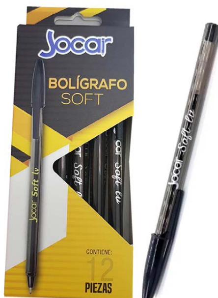
BOLIGRAFO LISO AHUMADO NEGRO