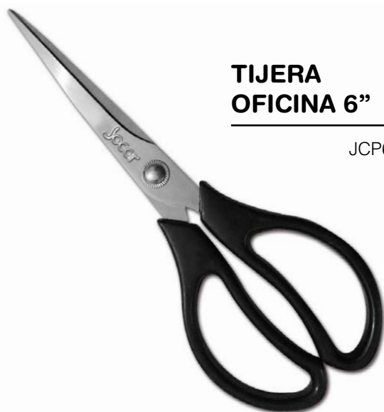
TIJERA OFICINA 6"